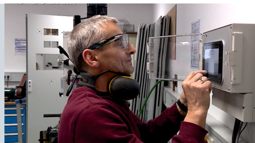
Geschulter und autorisierter Mitarbeiter gibt seinen individuellen Code in den PMF 1.8 ein.